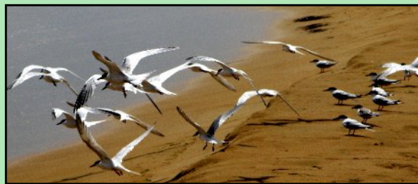
Gaviotas by Dr. Carlos Avilés González