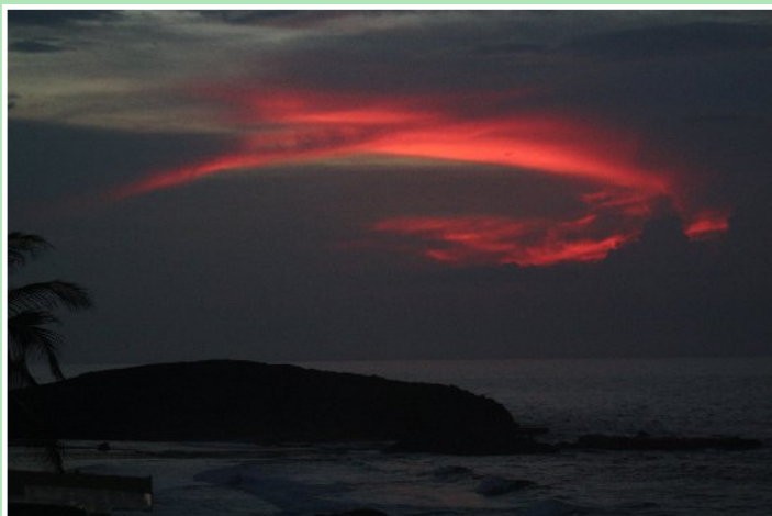
Atardecer en Montones [ALGR]

Siempre existe la alternativa de presentar una querrela en el propio Departamento cuando no se está de acuerdo con la forma y manera en que se dan los procedimientos. Sin embargo, es esencial que los padres y las madres de niños y niñas con necesidades especiales se orienten, conozcan sus derechos y comprendan el rol que viene obligado a cumplir el Departamento de Educación en el óptimo desarrollo de nuestros menores. Si bien es cierto que diferentes personas han tenido diferentes experiencias cuando participan del proceso arriba descrito también lo es que un padre y/o una madre comprometida con el presente y futuro de sus hijos e hijas, creará su propia historia de éxito, sin importar cuan fácil o difícil vaya manifestándose el camino.