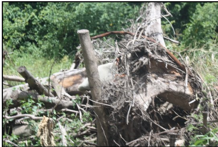
Dstrucción en nombre de la construcción del Paseo Lineal [ALGR]