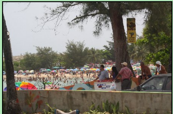
Jobos, 4 de julio de 2009 [ALGR]

La naturaleza es grande y se ocupa de hacer lo que los humanos con nuestro egoísmo e individualismo no hacemos. Meramente demos un vistazo a todas las epidemias, dengues, influencias y pandemias que existen en este momento. Les invito responsablemente a reflexionar, pensemos en lo dejamos para el futuro y seamos mas conservadores de la naturaleza, sino ésta se ocupará de darnos una lección.